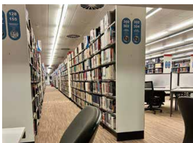
24時間解放している図書館