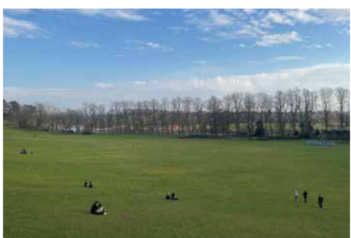
学校近くの公園に散歩