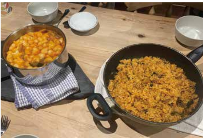
韓国の友達と晩御飯