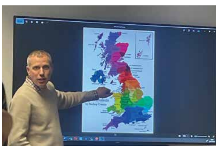
イギリスのアクセントについての授業